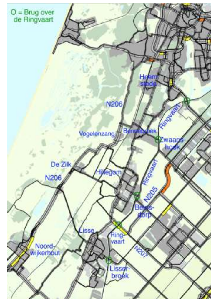
Kaart 1: I/C- verhouding Autonome situatie VENOM-2030 GE-scenario, ochtendspits

De Duinpolderweg die ruim € 150 miljoen moet kosten, blijkt volgens het door de provincie gebruikte VENOM- verkeersmodel een oplossing te zijn voor een niet bestaand probleem.