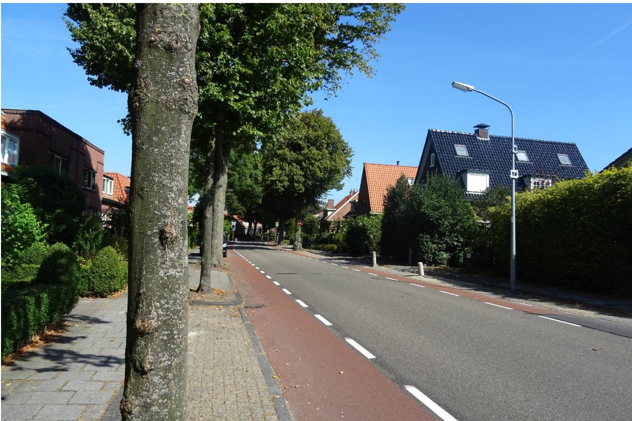
De Vogelenzangseweg in Vogelenzang, volgens de provincies een ernstig lokaal knelpunt (waarover zelfs een tranentrekkend promotiefilmpje is gemaakt). Volgens de Dorpsraad Vogelenzang valt het er sinds een aantal jaren best mee. Het verkeer neemt hier juist af en niet toe.

Op de andere, veel minder urgente punten is nog steeds volstrekt onduidelijk of de problemen dermate ernstig zijn dat nieuwe, grootschalige infrastructuur noodzakelijk is of dat met lokale verkeersmaatregelen kan worden volstaan. Onduidelijk blijft ook welke van deze probleempunten de hoogste urgentie hebben. Omdat de knelpunten zo sterk verspreid over de regio liggen zullen naar verwachting immers keuzes moeten worden gemaakt. Om uiteindelijk keuzes te kunnen maken moet duidelijk worden waar de prioriteiten liggen en waarom. Dat is te meer van belang omdat ook voor de lokale 'knelpunten' uiterst onzeker – volgens ons platform zelfs onwaarschijnlijk - is dat de veronderstelde sterke verkeersgroei inderdaad zal plaatsvinden.