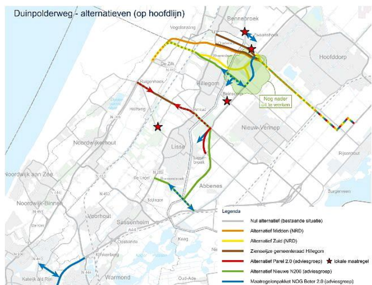
Het nieuwe plangebied met alternatieven sterk gespreid over de hele regio (voorstel GS)