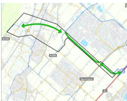
Het beperkte plangebied conform de NRD

Er is nog een ander punt waardoor het onderzoek naar de nieuwe alternatieven een farce dreigt te worden. De nieuwe door de Adviesgroep aangedragen alternatieven liggen grotendeels ver buiten het plangebied dat in de NRD door GS en de Staten is vastgesteld. GS erkennen dit weliswaar. Zij achten het echter niet nodig het oude besluit van de NRD op dat punt formeel te herzien. Wij achten dit een juridisch uiterst twijfelachtige keuze die later in het proces tot grote problemen en verwarringen kan leiden. Het betreft immers niet alleen een ondergeschikte aanpassing van het plangebied. Het nieuwe plangebied is zelfs vele malen groter dan het oude. Bovendien ging de NRD expliciet uit van de aanleg van slechts één weg. Verschillende van de nieuwe alternatieven bevatten daarentegen meerdere nieuwe wegvakken op verschillende plekken en wijken daarmee sterk af van de uitgangspunten van de NRD.