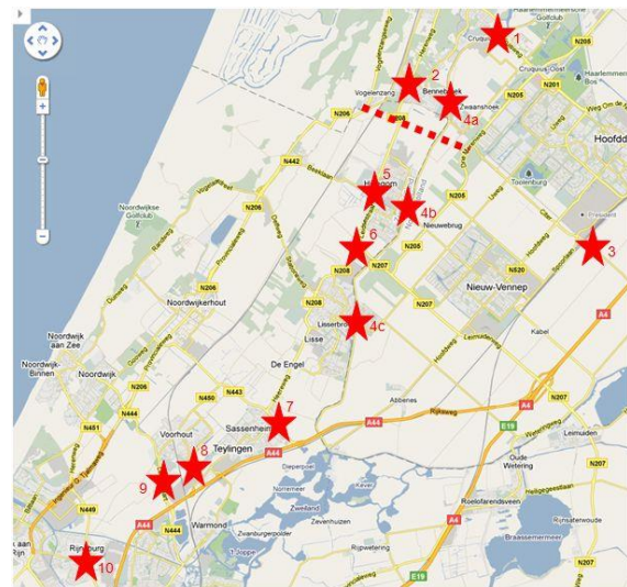
Verkeersknelpunten volgens NOG Beter 2.0 (rode sterren)