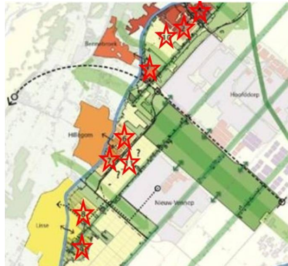
Spreiding Parellocaties (rode sterren)

In alle provinciale rapporten over een Duinpolderweg ontbreken uitspraken over de wijze waarop de woningbouwlocaties in de Haarlemmermeer kunnen worden ontsloten. Een gemiste kans! Als we in de regio, waar nodig, nieuwe infrastructuur aanleggen, moet deze ook optimaal dienen voor de ontsluiting van de woningbouwlocaties. Een Duinpolderweg doet dat helemaal niet (zie het rapport 'De Duinpolderweg - een voorwaarde voor de Parels aan de Ringvaart?' van Martin Bunnik). Sterker nog: in de onderzoeken van een Duinpolderweg zijn de effecten van de woningbouw op de Parellocaties niet eens meegenomen. De verkeersprognose van het VENOM-model is wat dat betreft zelfs misleidend.